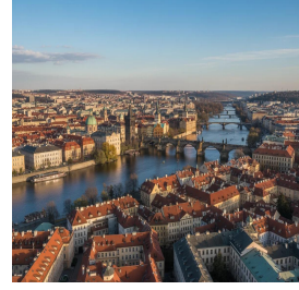
براغ - جمهورية التشيك