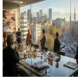
مدريد - إسبانيا