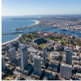
سان دييغو - الولايات المتحدة الأمريكية