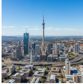
جوهانسبرغ - جنوب إفريقيا