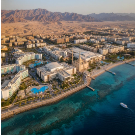
شهر الشيخ - قطر