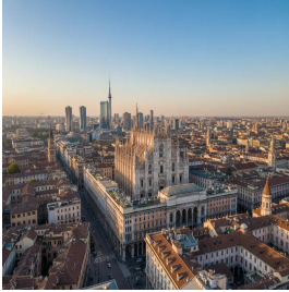
ميلان - إيطاليا