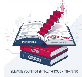
دورات المهارات الشخصية وتطوير الذات