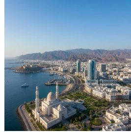
مسقط - سلطنة عمان