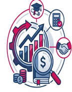
دورات المحاسبة و التمويل و دورات الإدارة الهائية