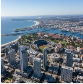
سان دييغو - الولايات المتحدة الأمريكية