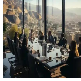
عمان - المملكة الأردنية الهاشمية