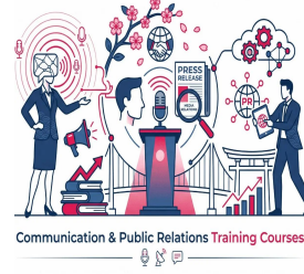
Communication & Public Relations Training Courses

دورات التدريب القانوني والمشتريات والتعاقدات