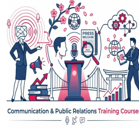
Communication & Public Relations Training Courses

دورات التدريب القانوني والمشتريات والتعاقدات