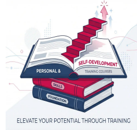
دورات المهارات الشخصية وتطوير الذات