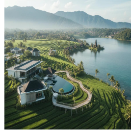
بالي - جمهورية إندونيسيا