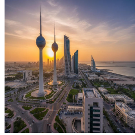
الكويت - الكويت