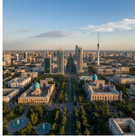
طشقند - أوزبكستان