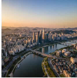
سيول - كوريا الجنوبية