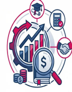
دورات المحاسبة و التمويل و دورات الإدارة الهائية