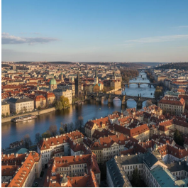
براغ - جمهورية التشيك