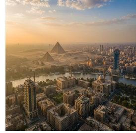
القاهرة - مصر