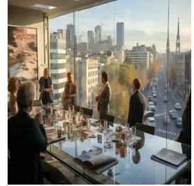
مدريد - إسبانيا