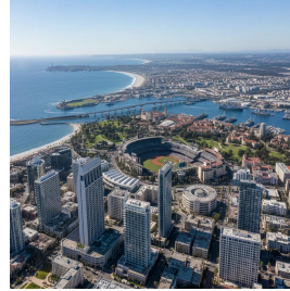
سان دييغو - الولايات المتحدة الأمريكية