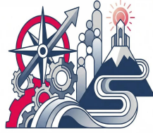
دورات في مجالات القيادة والإدارة