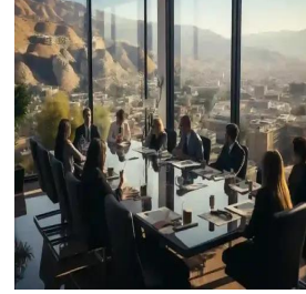
عمان - المهلكة الدرعية الهاشمية