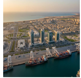
الجبيل - المملكة العربية السعودية