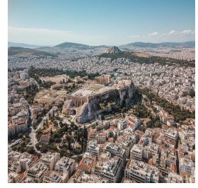
أثينا - اليونان