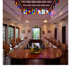
زنبار - تنزانيا