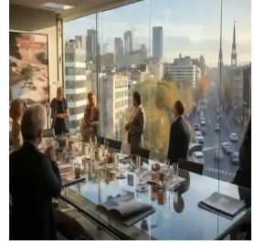
مدريد - إسبانيا