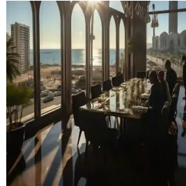
الدار البيضاء - المغرب