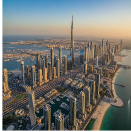
دبي - الامارات العربية المتحدة