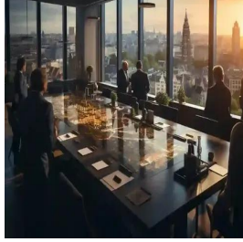
أمستردام - هولندا