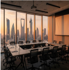
الرياض - المملكة العربية السعودية