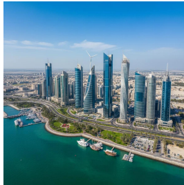
المنامة - مملكة البحرين