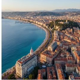
نيس - فرنسا