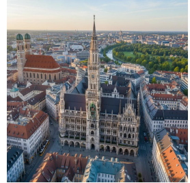
ميونخ - ألمانيا