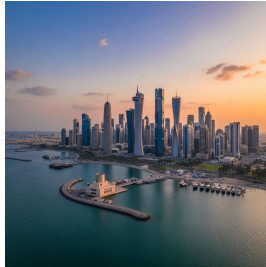
الدوحة - قطر