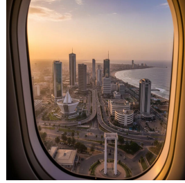
أنقرة - تركيا