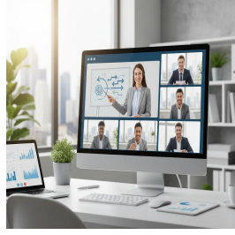
عن بعد - منصة زووم