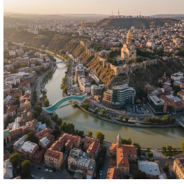
تبليسي - جورجيا