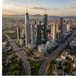
نيروبي - كينيا