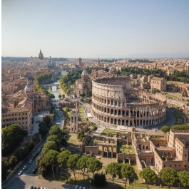
روما - ايطاليا