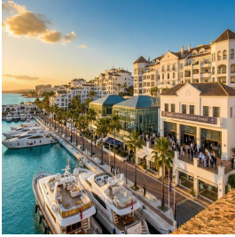
ماربيا - اسبانيا