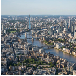
لندن - المملكة المتحدة