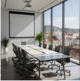
لشبونة - البرتغال