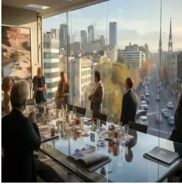
مدريد - إسبانيا