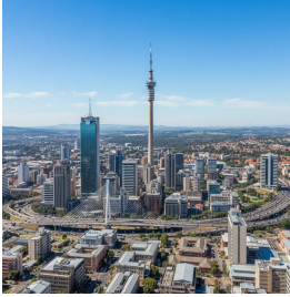
جوهانسبرغ - جنوب إفريقيا