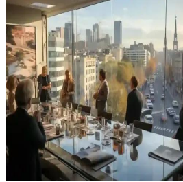
مدريد - إسبانيا