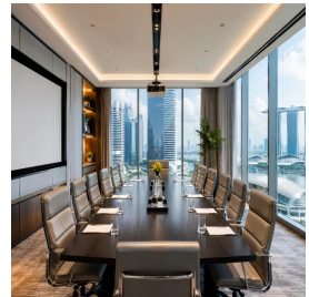
سنغافورة - سنغافورة