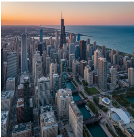
شيكاغو - الولايات المتحدة الأمريكية