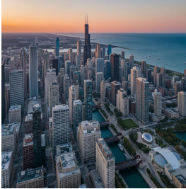
شيكاغو - الولايات المتحدة الأمريكية