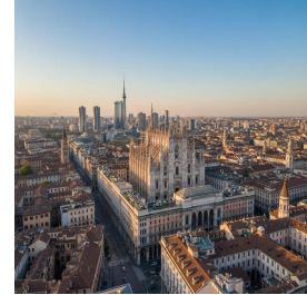
ميلان - إيطاليا