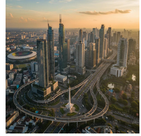
جاكرتا - جمهورية إندونيسيا