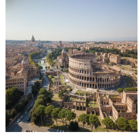
روما - إيطاليا