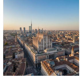
ميلان - إيطاليا