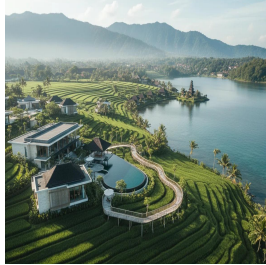
بالي - جمهورية إندونيسيا