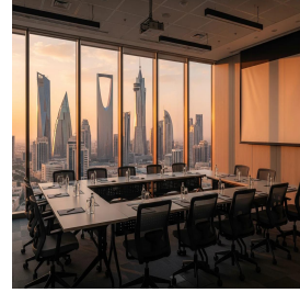
الرياض - المملكة العربية السعودية