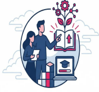
HR TRAINING & DEVELOPMENT