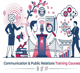
Communication & Public Relations Training Courses

دورات التدريب القانوني والمشتريات والتعاقدات