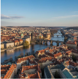
براغ - جمهورية التشيك