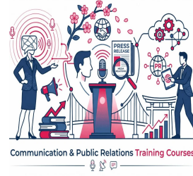
Communication & Public Relations Training Courses

دورات التدريب القانوني والمشتريات والتعاقدات