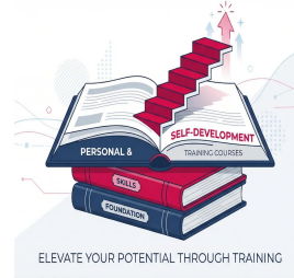
دورات المهارات الشخصية وتطوير الذات