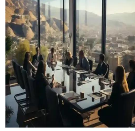
عمان - المملكة الأردنية الهاشمية