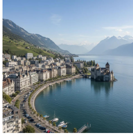
مونترال - سويسرا