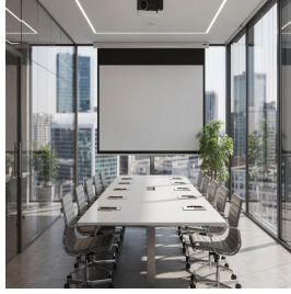
فرانكفورت - ألمانيا