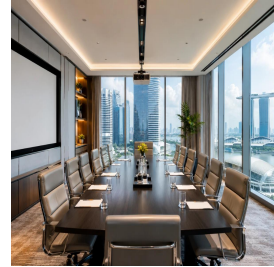
سنغافورة - سنغافورة