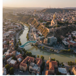
تيليسي - جورجيا