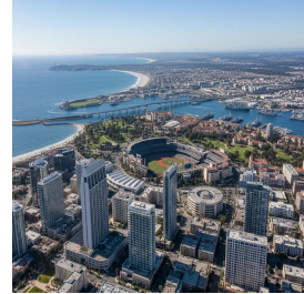
سان دييغو - الولايات المتحدة الأمريكية