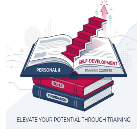
دورات المهارات الشخصية وتطوير الذات