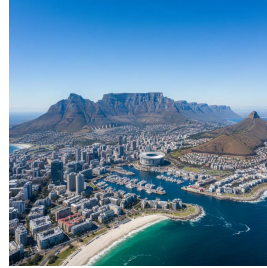
كاب تاون - جنوب إفريقيا