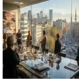
مدريد - إسبانيا