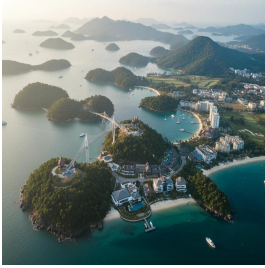
لانكاوي - ماليزيا