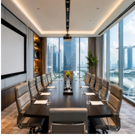
سنغافورة - سنغافورة