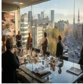
مدريد - إسبانيا