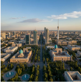
طشقند - أوزبكستان