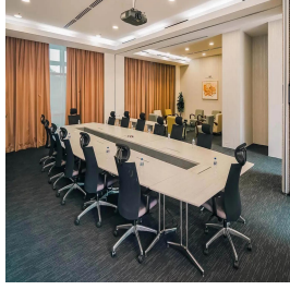
بوكيت - تايلاند