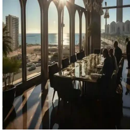
الدار البيضاء - المغرب