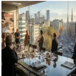
مدريد - إسبانيا