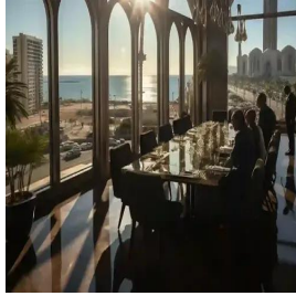
الدار البيضاء - المغرب