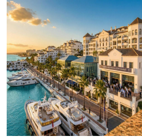
ماربيا - إسبانيا