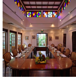
زنجبار - تنزانيا