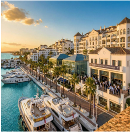
ماربيا - اسبانيا