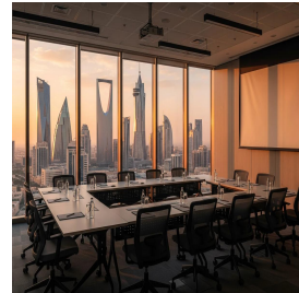
الرياض - المملكة العربية السعودية