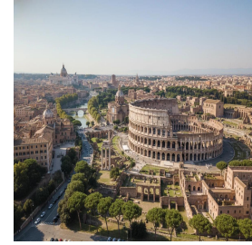
روما - إيطاليا