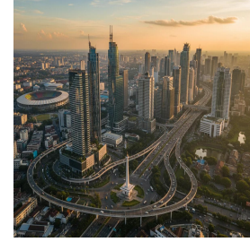
جاكرتا - جمهورية إندونيسيا