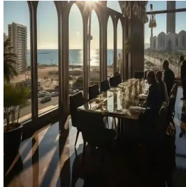
الدار البيضاء - المغرب