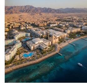
شرم الشيخ - مصر