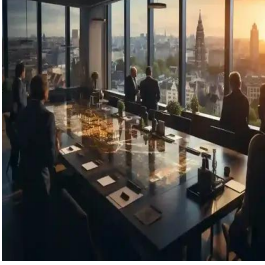
أمستردام - هولندا