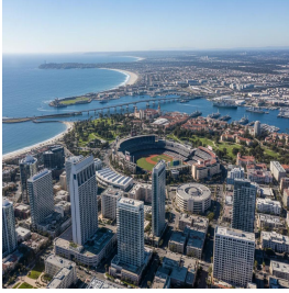
سان دييغو - الولايات المتحدة الأمريكية