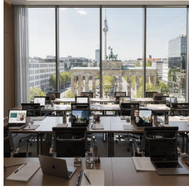
برلين - ألمانيا