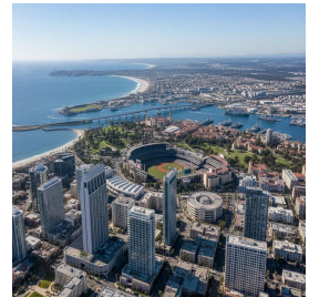
سان دييغو - الولايات المتحدة الأمريكية