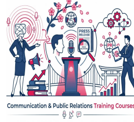
Communication & Public Relations Training Courses

دورات التدريب القانوني والمشتريات والتعاقدات