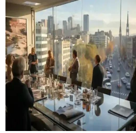
مدريد - إسبانيا