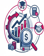
دورات المحاسبة و التمويل و دورات الإدارة المالية