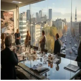
مدريد - إسبانيا