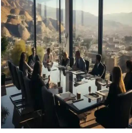
عمان - المهلكة التردنية الهاشمية