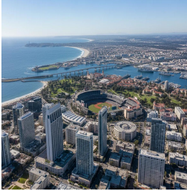
سان دييغو - الولايات المتحدة الأمريكية