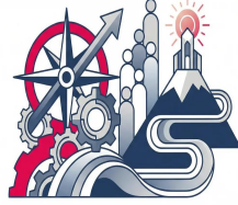
دورات في مجالات القيادة والإدارة