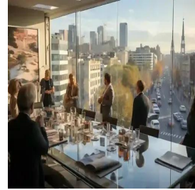
مدريد - إسبانيا