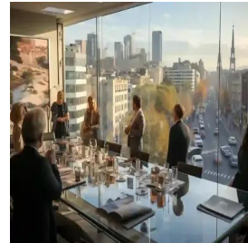
مدريد - إسبانيا