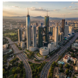
نيروبي - كينيا