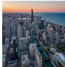
شيكاغو - الولايات المتحدة الأمريكية