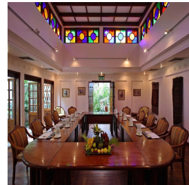
زنبار - تنزانيا