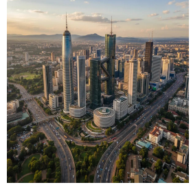
نيروبي - كينيا